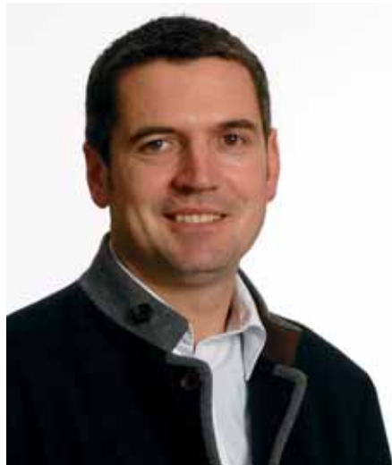
Evropski poslanec Herbert Dorfmann

Tudi na letošnjih evropskih volitvah je Južnotirolska ljudska stranka (SVP), s katero je sodelovala Slovenska skupnost, brez težav izvolila evropskega poslanca. Tokrat jih ima Italija 72 (prej 78). Na podlagi olajšav za manjšine, ki jih vsebuje italijanski zakon za izvolitev evropskih poslancev (dejansko koristijo le južnotirolski skupnosti, ker za olajšano izvolitev zahtevajo vsaj 50.000 preferenc!) in povezave med SVP in Demokrasko stranko je bil izvoljen nosilec liste Herbert Dorfmann, ki smo ga lahko spoznali tudi v Gorici in Trstu. „Lista planike“ je nastopala le v severovzhodnem okrožju (Furlanija Julijska krajina, Veneto, Tridentinska - Južna Tirolska in Emilija - Romagna). Zbrala je 142.482 glasov. Dorfman je zbral 84.396 preferenc (od tega 83.768 v domači pokrajini Bocen).