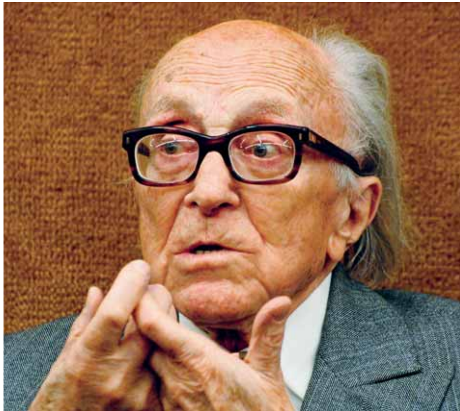
Naš evropski kandidat, prof. Boris Pahor