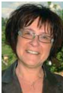
Franka Padovan , županja, neposredno pristojna za šolstvo, kulturo, socialno in javna dela